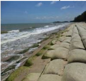
ชลาทิศน์ จ.สงขลา