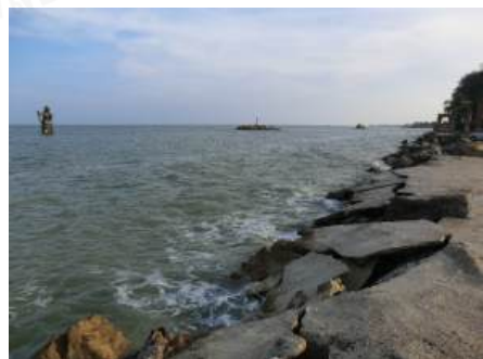
หาดจ้าวสำราญ เพชรบุรี