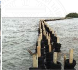
บ่อมพระจุล จ.สมุทรปราการ