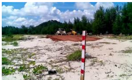
ภาพที่ 4.2 ผลกระทบที่แหลมสนอ่อน

หลังจากนั้นไม่นาน ทรายที่ได้เติมไว้ด้านหน้าหาด ซึ่งไม่ทราบจำนวนและไม่ได้แล้วเสร็จตามที่ได้ตั้งโครงการไว้ก็ถูกน้ำทะเลเซาะหายไปมากที่สุด แสดงดังภาพที่ 4.3 ส่วนพื้นที่แหลมสนอ่อนแม้ธรรมชาติจะค่อยๆเยียวยาตัวเองได้ แต่ถนนดินลูกรังยังคงทับอยู่บนสันทรายยาวเกือบตลอดแนว ส่งผลให้ภูมิทัศน์ของแหลมสนอ่อนเสียหายบางส่วน