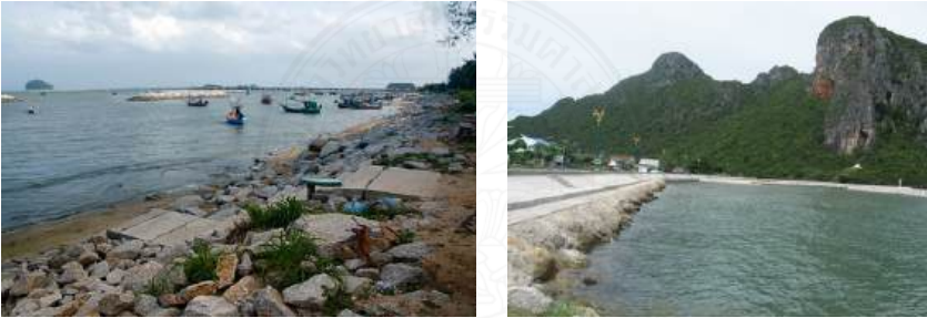
ภาพที่ 3.2 ผลกระทบที่เกิดจากโครงการ

เนื่องจากโครงสร้างป้องกันชายฝั่งที่มีอยู่อย่างมากมายบริเวณนี้ ทั้งที่กล่าวถึงในคดีและที่ไม่ได้ปรากฏในคดี ส่งผลให้กระแสน้ำเปลี่ยนแปลงทิศทางและไหลซาลงเนื่องจากการวางตัวกีดขวางการไหลของน้ำและตะกอนชายฝั่งของโครงสร้างต่าง ๆ ส่งผลให้ชายหาดทรายบางส่วนกลายเป็นเลน จอดเรือลำบาก ไม่สวยงามและไม่สามารถเล่นน้ำได้เหมือนในอดีต ทั้งยังส่งผลต่อระบบนิเวศสัตว์หน้าดินด้วย ส่วนชายหาดที่อยู่ด้านหลังเขื่อนกันคลื่นนอกชายฝั่งแบบหินทิ้ง ณ ปัจจุบัน ได้ถูกเปลี่ยนแปลงสภาพเป็นกำแพงกันคลื่นแบบหินทิ้งเกือบตลอดทั้งแนวชายหาดแล้ว เนื่องมาจากการกัดเซาะที่เกิดจากอิทธิพลของกำแพงกันคลื่นนอกชายฝั่งนี้ แสดงดังภาพที่ 3.2