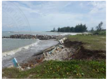
บ่ออิฐ จ.สงขลา