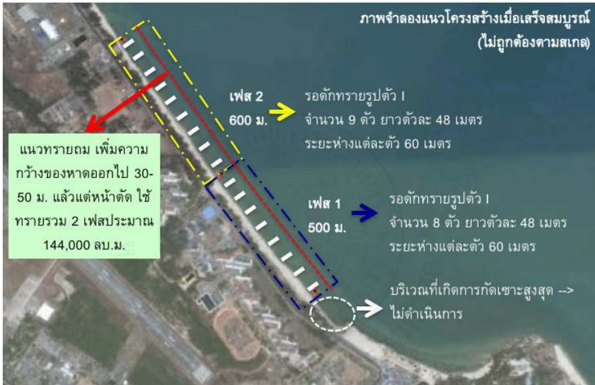
ภาพที่ 4.1 องค์ประกอบของโครงการป้องกันชายฝั่งหาดสมิหลา-ซลาทัศน์ (ที่มา: ตัดแปลงจาก Google earth)

วิชาการเติมทรายจำเป็นต้องตรวจสอบถึงคุณสมบัติของทรายที่นำมาถมบนชายหาดตลอดจนเทคนิควิธีการที่จะต้องเป็นไปตามหลักวิชา มิฉะนั้นอาจส่งผลให้การเติมทรายขาดประสิทธิภาพโดยทรายจะถูกคลื่นและลมพัดพาหายไปจากชายหาดในเวลาอันรวดเร็ว แต่ไม่ปรากฏว่ามีหลักฐานรายงานการศึกษาเรื่องดังกล่าวในการดำเนินโครงการ