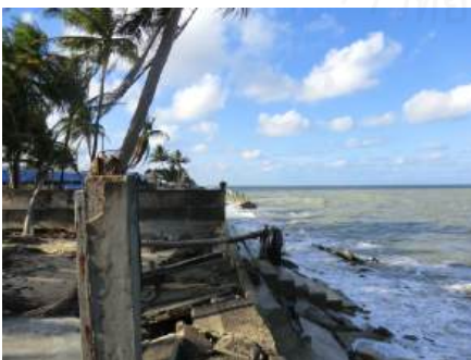
หัวไทร นครศรีธรรมราช