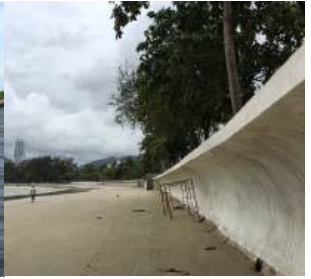
ป่าตอง จ.ภูเก็ต