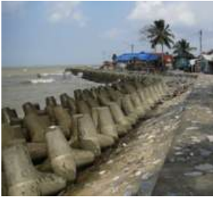
บ้านบางตาawa จ.ปัตตานี