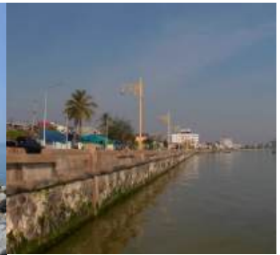
ชลาทิศน์ จ.สงขลา