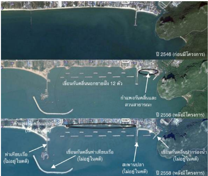
ภาพที่ 3.1 โครงการเชื่อมป้องกันคลื่นและโครงการก่อสร้างสวนสาธารณะ ชายหาดคลองวาฬ (ที่มา: ดัดแปลงจาก Google earth)

คอนกรีตป้องกันคลื่นนั้น สามารถมองเห็นหาดได้ยามน้ำลงบางครั้ง การขึ้นลงชายหาดเป็นไปได้ยากยิ่งเพราะต้องปีนข้ามสันและแนวลาดของกำแพงซึ่งอยู่สูงกว่าชายหาดมาก ส่วนในฤดูมรสุมคลื่นที่วิ่งเข้ามาปะทะกำแพงแนวตั้งส่งผลให้มีน้ำทะเลกระเซ็นข้ามสันกำแพงขึ้นมาบนทางเดินริมกำแพงบ้าง