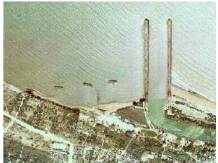
(ข) ปี พ.ศ. 2545 หลังมีโครงการ