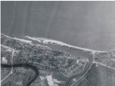
(ก) ปี พ.ศ. 2538 ก่อนมีโครงการ

คลื่นปากร่องน้ำ (Jetty) จำนวน 2 ตัว ยาวประมาณตัวละ 600 เมตร โดยวัตถุประสงค์เพื่อป้องกันตะกอนตกทับถมปากแม่น้ำและลดการขุดลอกตะกอนที่มาปิดปากร่องน้ำ นอกจากนั้นยังได้สร้างเขื่อนกันคลื่นนอกชายฝั่ง (Breakwater) อีกจำนวน 4 ตัว ทางทิศตะวันตกของปากร่องน้ำ (ภาพที่ 2.1ข) เพื่อป้องกันการกัดเซาะชายฝั่งที่เป็นผลกระทบจากเขื่อนกันทรายและคลื่นปากร่องน้ำ แสดงองค์ประกอบของโครงสร้างดังภาพที่ 2.2