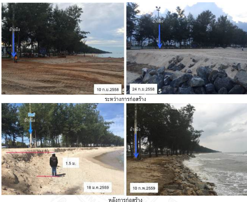
ระหว่างการก่อสร้าง