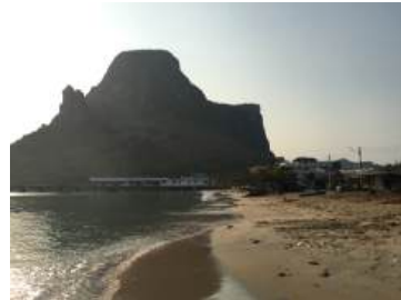
ภาพที่ 5.1 ก ก่อนการก่อสร้าง