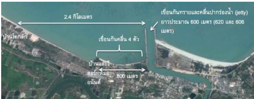
ภาพที่ 2.2 องค์ประกอบของโครงการบริเวณปากน้ำสะกอม