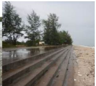
สทิงพระ จ.สงขลา