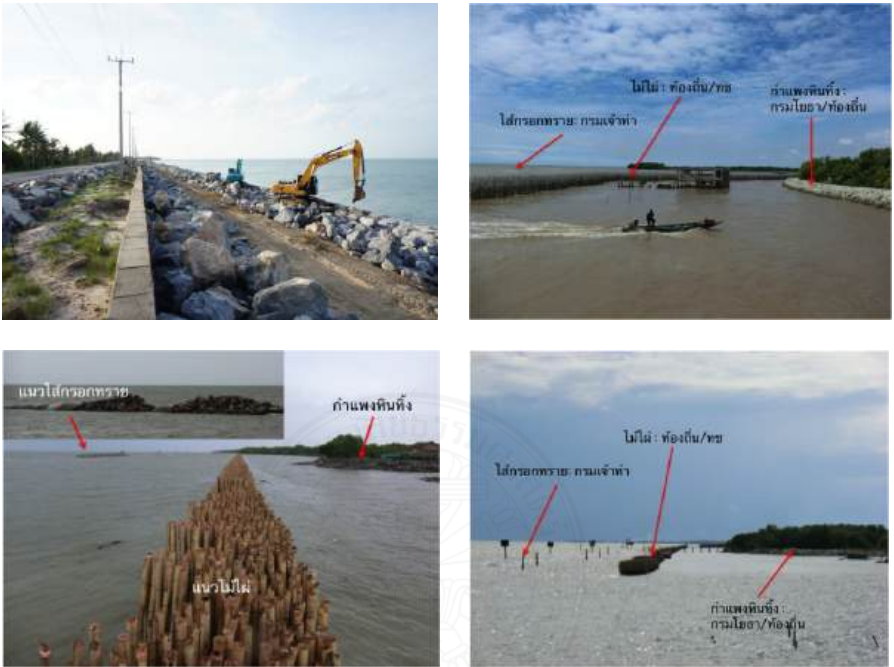
ภาพที่ 1.4 การทับซ้อนกันของโครงสร้างป้องกันชายฝั่ง