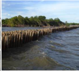
โคกขาม จ.สมุทรสาคร