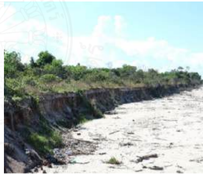
ภาพที่ 2.3 ชายฝั่งที่ถูกกัดเซาะทางทิศตะวันตกของปากร่องน้ำสะกอม (พ.ย.2560)