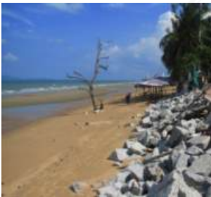
หาดจอมเทียน จ.ชลบุรี

อย่างไรก็ตาม แม้การใช้โครงสร้างทางวิศวกรรมจะมีข้อดีหลายประการ แต่ก็พบว่าก่อให้เกิดผลกระทบด้านลบต่อพื้นที่ข้างเคียง ทั้งนี้ เพราะโครงสร้างทางวิศวกรรมนั้นได้เปลี่ยนแปลงรูปแบบการเคลื่อนที่ของกระแสน้ำและตะกอนชายฝั่งทะเล ส่งผลกระทบต่อสมดุลตามธรรมชาติ แม้จะสามารถป้องกันพื้นที่เป้าหมายบางส่วนไม่ให้เสียหายได้ แต่มักก่อผลกระทบให้พื้นที่ข้างเคียงเกิดการกัดเซาะหรือถูกกัดเซาะเพิ่มมากขึ้น นอกจากนี้แล้ว ยังก่อให้เกิดการสูญเสียทัศนียภาพของชายหาด สูญเสียการใช้ประโยชน์พื้นที่ชายหาด และขัดขวางการเข้าถึงทรัพยากรชายฝั่งทะเล (ภาพที่ 1.3)