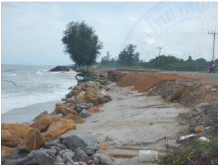
บ่ออิฐ จ.สงขลา