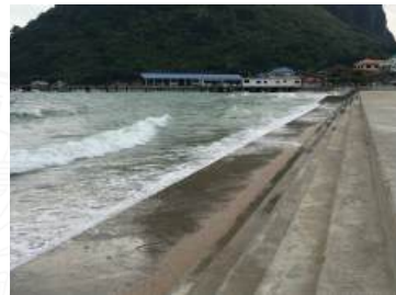
ภาพที่ 5.1 ข โครงสร้างที่แล้วเสร็จบางส่วน