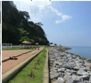
ชลาทิศน์ จ.สงขลา